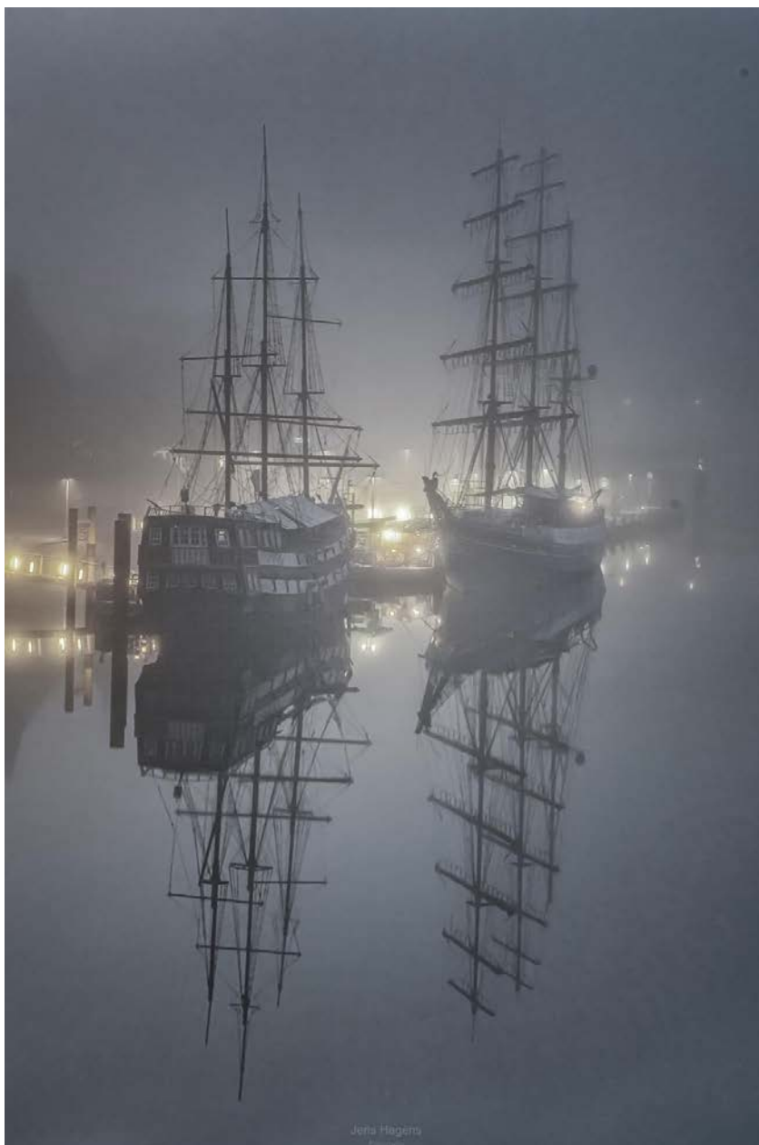
Admiral Nelson y Alexander von Humbolt atracados en un muelle en el rio Weser (01.11.2022).