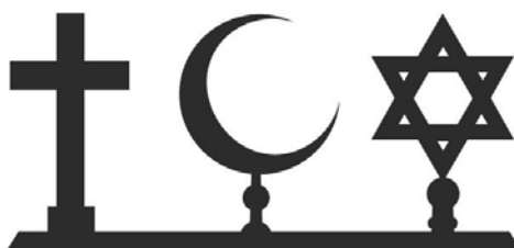
Los símbolos de las religiones, cristiana, musulmana y judía

Según la tradición judía, cristiana e islámica, el monoteísmo es la primera religión de la humanidad, ya que Dios mismo la da en mandato a Adán y Eva.